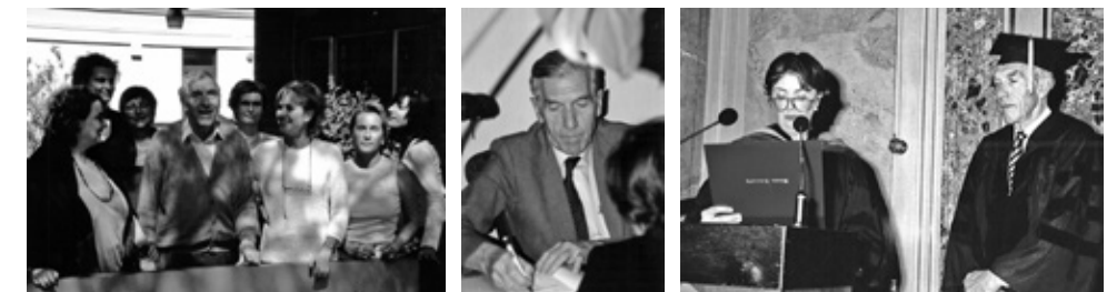
Abbildung 4: 2004 mit österreichischen Kolleginnen am MRI in Palo Alto, 1997 beim Bücher signieren am IST in Wien und 1999 bei der Verleihung des Ehrendoktorats der Webster University während seines letzten Wienaufenthalts

Nach einem ereignisreichen Leben wird Paul Watzlawick langsam alt. 1999 kommt er gesundheitsbedingt das letzte Mal nach Europa und dabei auch wieder nach Wien. Er hält einen Vortrag für die Viktor Frankl Gesellschaft, erhält eine Ehrung der Wiener Ärztekammer, hält ein letztes Mal ein Seminar am Institut für Systemische Therapie und bekommt an der Webster University ein Ehrendoktorat für sein Lebenswerk überreicht. Alle weiteren Treffen mit ihm finden während unserer Studienreisen nach Palo Alto 2001 und 2004 statt, und ich (SG) treffe ihn ein letztes Mal 2006 in seinem Büro am MRI.