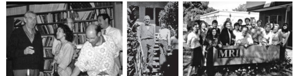
Abbildung 3: Weihnachtsfeier 1990 am MRI, 2004 auf den Stiegen im Innenhof des MRI und mit Wendel Ray und Study Tour TeilnehmerInnen am Eingang des Mental Research Instituts in Palo Alto

Trotz des Erfolgs in der Außenwelt ist Paul Watzlawick in seinem Innenleben noch auf der Suche, was er im „Vom Schlechten des Guten“ wohl autobiografisch wie folgt beschreibt.